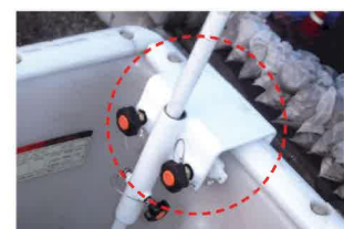
バケットクランプ