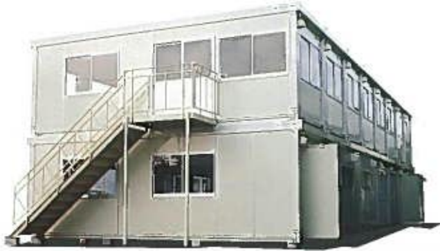
CAR 531 OP装着例