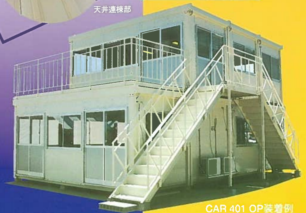
CAR 401 OP装着例